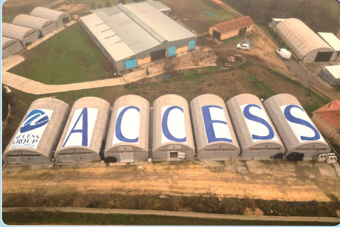
اختيارنا الإمارات المقر الإقليمي لـ "مجموعة أكسس العالمية" في الشرق الأوسط يدعم استراتيجياتنا